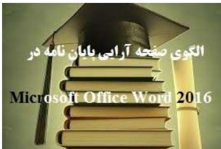
شکل ۱-۴. زیرنویس شکل